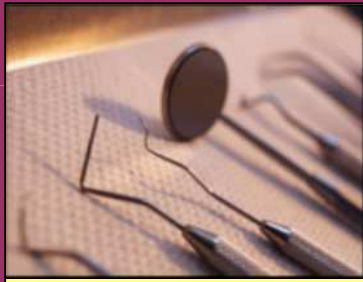
La panoplie du dentiste