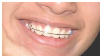
le coût élevé des soins médicaux n'empêche pas le sourire...

En 2007 les États-Uniens ont dépensé 7 439 dollars par personne. D'après l'Institut de Médecine de l'Académie Nationales des Sciences, les États-Unis sont la seule nation riche industrialisée qui n'a pas de système universel de soins de santé. Aux Etats-Unis, environ 84,7% des citoyens souscrivent à diverses formes d'assurance médicale. Certains programmes de santé sont financés au moyen de ressources publiques pour aider les vieux, les handicapés, les enfants, les anciens combattants et les pauvres. En 2007, le nombre d'Américains sans assurance médicale s'est élevé à environ 45,7 millions de personnes.