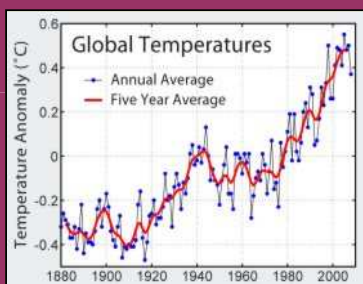
La Terre se réchauffe