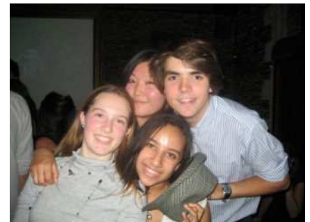
Avec mes amis d'Angers...

Je me suis également fait de nombreux amis de partout dans le monde, il y en a certains qui parlaient anglais, et d'autres non. Je n'aurais pas pensé, avant d'aller en France, qu'il était facile de devenir amis avec quelqu'un qui ne parle pas votre langue ! Cependant, je sais maintenant que c'est très possible. L'amitié dépasse les frontières de la langue et de la culture.