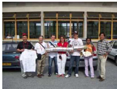
La fusée, sous toutes ses formes, est un vecteur privilégié pour développer les liens entre La Réunion et Gifu.

Fusées à eau et clubs spatiaux, fusées expérimentales et quasi-satellites pour des opérations conjointes entre jeunes de nos deux régions, les activités éducatives spatiales sont au cœur des rencontres entre La Réunion et Gifu.